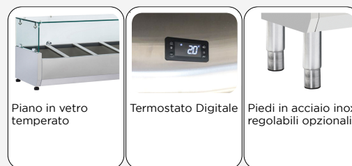
Piano in vetro temperato